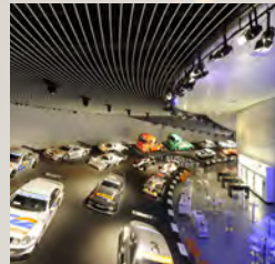
STUTT GART Mercedes-Benz Museum