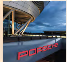
LEIPZIG Porsche Zentrum