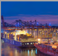
REE Location Hafen City